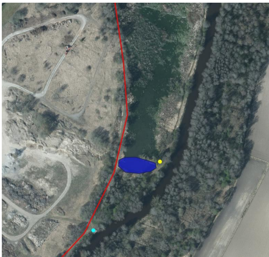
Bild 5. Reningsdammen. Blå yta är sedimentationsdammen, vattnet strilar sedan norrut genom våtmarken. Gul prick är grillplatsen. Ljusblå prick visar räddningstjänstens övningsbrygga (info under punkt 2 sid 9).

Vid anläggandet av reningsdammen anlades även en grillplats vid den udde som skapades invid Tämnrån. Den används flitigt av närboende och av förskolor. Grillplatsen kan behöva ses över och uppraderas.