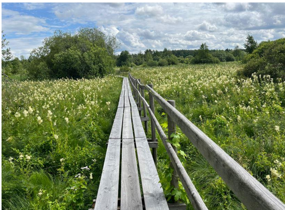
Bild 4. Spången år 2024.