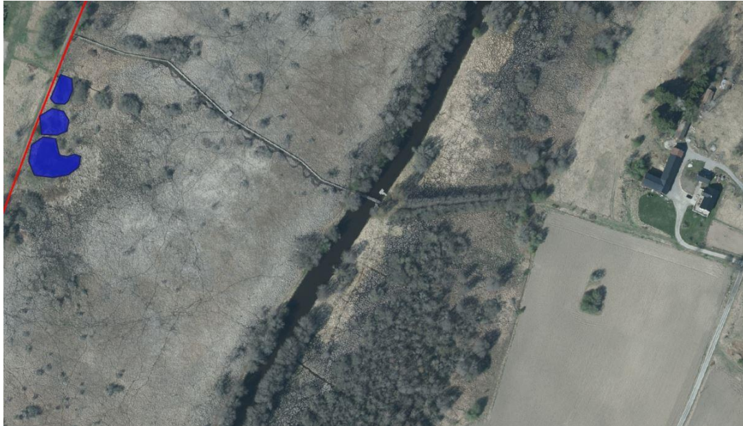
Bild 3. Spången korsar våtmarken mellan banvallen och skoterklubbens bro över Tämnarån.

Spången används mycket flitigt. Passage med barnvagnar har setts ske genom att vagnen lutas kraftigt för att få plats, och barn ska samtidigt bäras. Så det finns förbättringsbehov. Planer på att göra en större förändring för att öka tillgängligheten och passerbarheten längs spången (och hela promenadslingan) har funnits under flera år. 2022 genomfördes dock en åtgärd för att tillfälligt förbättra passerbarheten, i väntan på en större förändring. De två brädorna byttes då till tre brädor, så passagen blev något tryggare. Mer om det planerade tillgänglighetsprojektet under punkt 1-4 på efterföljande sidor.