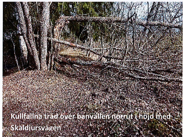
Kullfalna träd över banvallen norrut i höjd med Skaldjursvägen