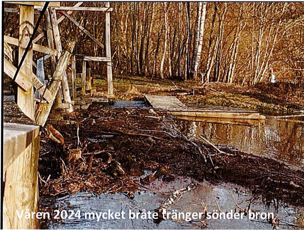
Våren 2024-mycket bråte tränger sönder bron