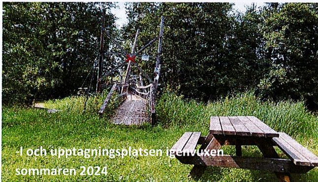
I och upptagningsplatsen igenvuxen sommaren 2024