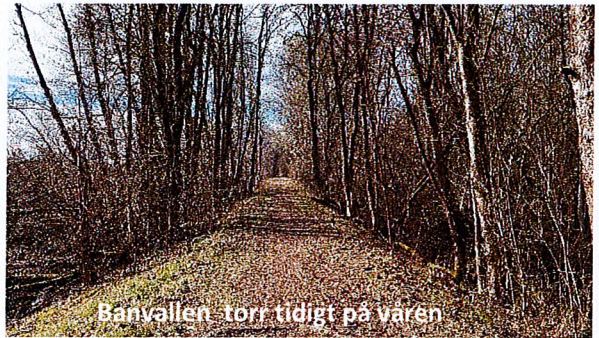
Banvallen - torr tidigt på våren