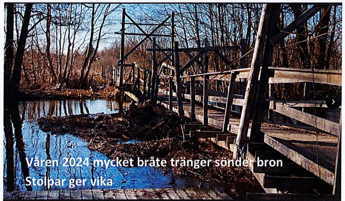
Våren 2024-mycket bråte tränger sönder bron Stolpar ger vika