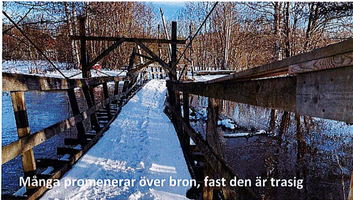
Många promenerar över bron, fast den är trasig