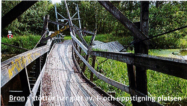
Bron stötar har gått av i- och uppstigning platsen