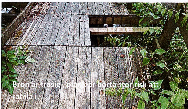
Bron är trasig - planer är borta stor risk att ramla i