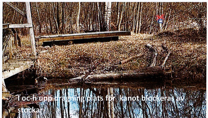
I och upp dragning plats för kanot blockeras av stockar